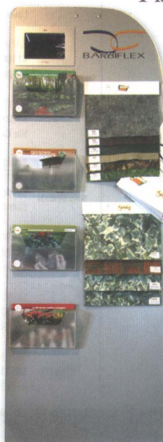
Il totem che spiega i vantaggi del prodotto Hoasi.

Il prodotto presenta differenti formati che permettono di rispondere alle diverse esigenze del consumatore: le versioni cocco, terra e muschio sono disponibili in rotoli dall'altezza di 1-2-4,5 metri e di lunghezza di 50 millimetri o superiore (a richiesta); mentre le versioni corteccia e prato, si possono ordinare in rotoli dalle misure standard con un'altezza di 1-2 metri per 50 millimetri di lunghezza o superiore, sempre su richiesta. Inol-