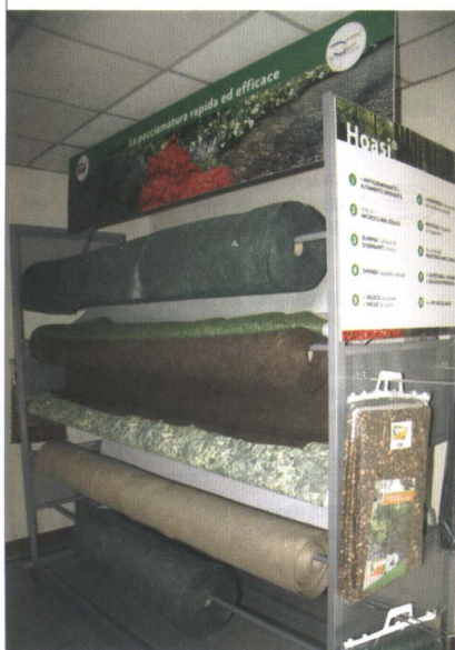
Il carrello per la vendita di Hoasi all'interno del negozio.