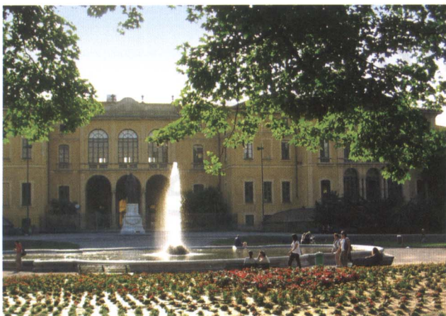
I giardini pubblici di Milano.

tre, tutte le versioni sono disponibili nel formato self nella duplice dimensione 1 per 10 metri e 2 per 5 metri.