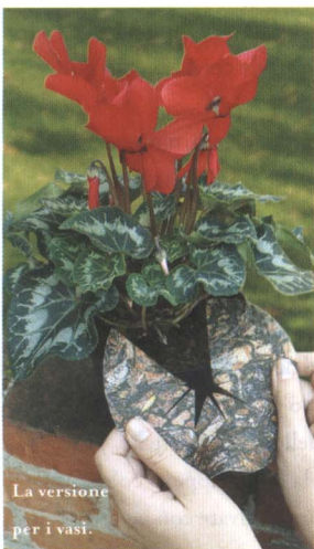
La versione per i vasi.

di una vendita assistita, è necessario spiegare al consumatore i reali vantaggi che si possono ottenere con l’utilizzo di questo originale sistema pacciamante. Provare per credere!